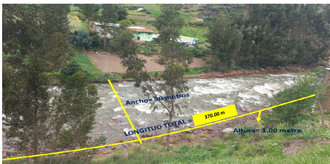
VISTA N° 2: TRAMO GENERAL DEL MARGEN DEL RIO SANTA - ACO CON PUNTO INICIAL E= 227035; N= 8932556.00 Y PUNTO FINAL E= 226948.00; N= 8932908.00, DONDE SE REALIZARA LA DESCOLMATACION DE CAUCE Y CONFORMACION DE BORDO EN EL MARGEN DERECHO