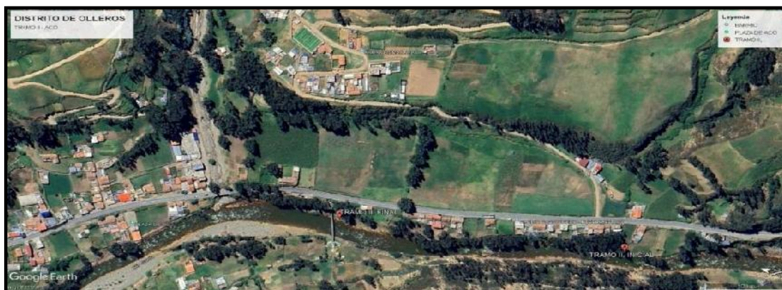
VISTA N° 1: TRAMO GENERAL DEL MARGEN DEL RIO SANTA- ACO CON PUNTO INICIAL E= 227035; N= 8932556.00 Y PUNTO FINAL E= 226948.00; N= 8932908.00, DONDE SE REALIZARA LA DESCOLMATACION DE CAUCE Y CONFORMACION DE BORDO EN EL MARGEN DERECHO